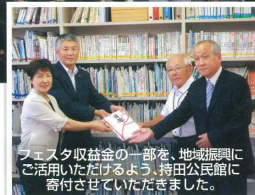
フェスタ収益金の一部を、地域振興にご活用いただけるよう、持田公民館に寄付させていただきました。

「ハレの日・ケの日」という言葉がありますが、利用者さんは何カ月も前から「もうすぐ祭りだね」と話題にして下さいます。ハレの日があるから毎日を穏やかに暮らせる…季節行事は福祉事業に欠かせないものです。市障がい者福祉課長様のお言葉を始め、企業・団体・個人様の共催・協賛・後援・お祝い、従業員数141名をはるかに超える214名のボランティア様の志のこもったご支援を賜り、全職員が力を出し切る程のハレの日が生まれました。千鳥福祉会は日本一幸せ者です。来年も地域の皆さんに喜んで頂けるよう頑張ります。どうかよろしくお祈りいたします。