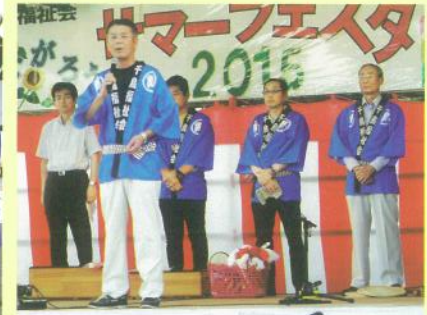
後援会/川上会長様・役員の皆様