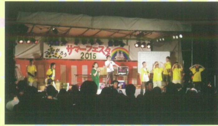
▲サマーフェスタの売り上げの一部を 松江市東持田町振興協議会に寄付いたしました。