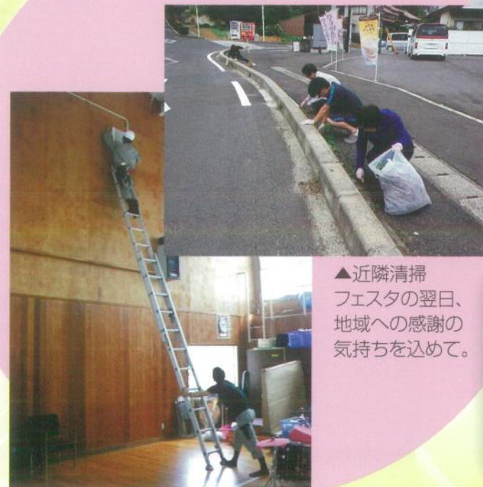
▲近隣清掃 フェスタの翌日、 地域への感謝の 気持ちを込めて。