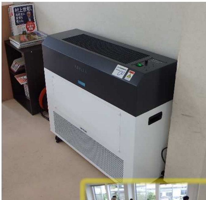
紫外線空気清浄機 L.C.C.ういんぐ食堂

事業名 2021年度新型コロナウイルス感染症の拡大防止策に対する緊急支援事業 事業内容 空気清浄機の整備 障がい者支援施設 持田寮 加湿式空気清浄機 居室用 15台 多機能型事業所 L.C.C.ういんぐ 紫外線空気清浄機 食堂用 1台 補助金額 1,235,000円 実施場所 島根県松江市東持田町1415 完了年月日 2021年10月18日